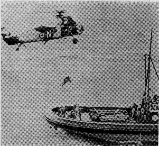
Prevoz ranjenog Holandanina na remorker