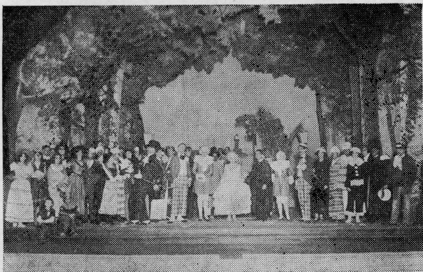
Sa praizvedbe Tijardovićeve operete »Mala Floramye« u Splitskom kazalištu 14. januara 1926. — Karneval na rivi

Oslobođenjem zemlje počinje novo razdoblje u životu i djelovanju Ive Tijardovića. Preuzima položaj intendant Hrvatskog narodnog kazališta u Zagrebu a kasnije i mjesto direktora Zagrebačke filharmonije. Otada prelazi na ozbiljnije muzičko stvaralaštvo pa osim baleta »Partizansko kolo« nastaju gore spomenuta operna djela. Komponira skladbe za komorne sastave, pjesme, zborove a osobito muziku za mnoge igrane i dokumentarne filmove. U svojim djelima naš proslavljeni jubilarac mnoga zbivanja nadovezuje na tradiciju. Ostajući dosljedan i vjeran pobornik nacionalnog muzičkog smjera on obogaćuje svoju inspiraciju na muzičkom folkloru svoje rodne grude i onda kada ne primijenjuje izvornu narodnu melodiju. Najvažniji elemenat njegove muzike je raspjevana melodika mediteranskog obilježja kojoj su podređeni svi ostali faktori muzičkog izražavanja. Naš popularni umjetnik za svoje zasluge na polju nacionalnog stvaranja odlikovan je u više navrata i nosilac je zavidnih odlikovanja s jugoslavenskih i stranih muzičkih pozornica a za osobite svoje kvalitete i rad, na širenju narodnog melosa i folkloru, odlikovan je Ordenom za zasluge za narod I stupnja. Mnogim čistitkama, koje još uvijek stižu iz zemlje i izvana, priključuje se i redakcija našeg lista.