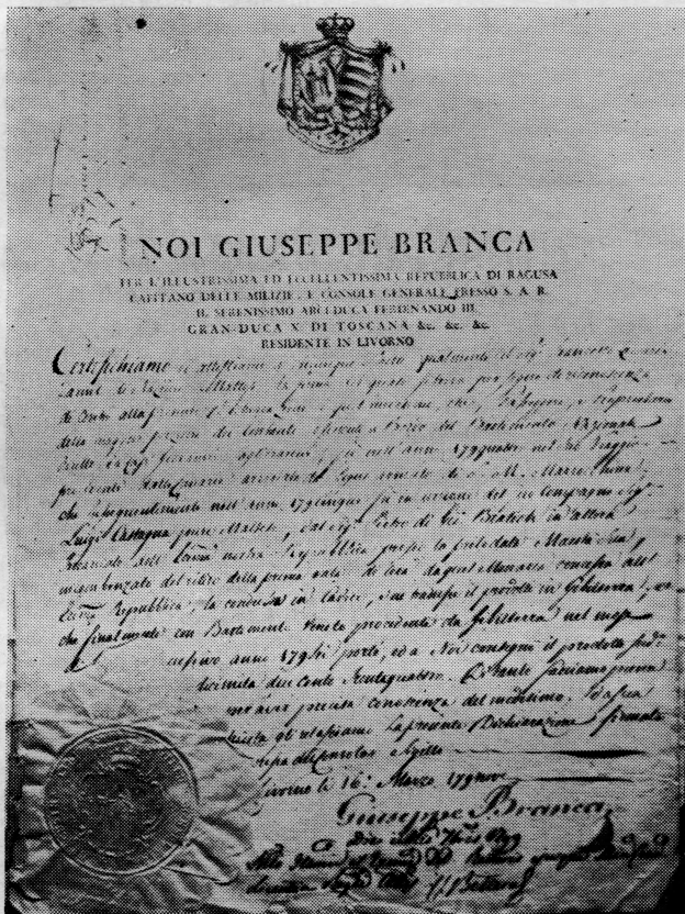
Potvrda sa pečatom dubrovačkog konzulata izdata u Livornu