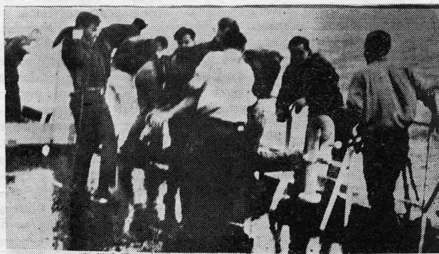
Brodolomci izlaze na palubu »Mathilde Bolten«

brod »Mathilde Bolten«, »Roch Away« je uspio da uzme u tegalj brod u pogibelji, ali je radi oluje i jakih trzaja poslije par sati tegalj pukao. Nije se moglo više ništa učiniti. Komandant »Smith Voyager-a« Frederik Mokle, naredio je napuštanje broda. Spušteni su čamci za spasavanje, bačene splavi, a »Mathilde Bolten« pošao je prema brodolomcima. Međutim jedan čamac se potonulo, a dva su izgubljena.