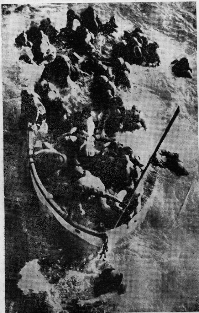
Čamac za spasavanje sa »Smith Voyager«

Poslije sedam dana agonije »Smith Voyager« je potonuo 700 milja od obale Bermudskog otočja.