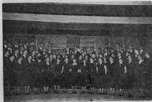
Pjevački zbor RKUD »29. novembar« na kulturnoj smotri u Dubrovniku 22. V 1954.

Pomorski muzej Jugoslavenske akademije znanosti i umjetnosti smješten je na prvom katu monumentalne tvrđave sv. Ivana u gradskoj luci. Ekspoziti prikazuju četiri razdoblja dubrovačkog pomorstva. Posjeduje biblioteku od 3500 djela stručne pomorske strane i domaće literature od 16. stoljeća do novijeg doba.