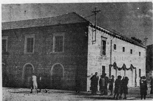
Dom kulture u Stonu za vrijeme kulturno-prosvjetne smotre dana 29. IV 1951. godine

Godine 1954. osnovan je Pododbor Matice Hrvatske koji je razvio kulturnu djelatnost putem predavanja, akademija,