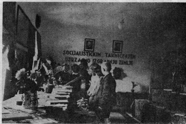
Izložba knjiga, narodne štampe i fotografija u Dubrovačkoj Župi 1., 2. i 3. maja 1951. godine

U Dubrovniku je otvoren Radnički dom »Ivo Mordin-Crni« i Dom kulture u Gružu u kojima su otvoreni kinematografi i biblioteke. Općinska biblioteka u Radničkom domu broji danas 23.500 knjiga, a u 1964. godini izdala je na čitanje 51.252 knjige. Pored ovog broja izdatih knjiga na čitanje van biblioteke, izdato je posjetiocima u čitaonici oko