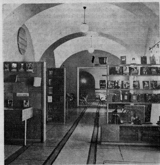
Čitaonica biblioteke Općinskog sindikalnog vijeća u Dubrovniku

izložbi i drugog rada. Osnovano je Društvo prijatelja dubrovačke starine koje je mnogo doprinijelo zaštiti spomenika kulture. Njegovim nastojanjima smješten je i uređen lapidarij u tvrđavi Bokar. Osnovano je više raznih kulturno-prosvjetnih, sportskih, tehničkih, turističkih i drugih društava u Dubrovniku i na području općine — preko 100 raznih društava, društava i saveza.