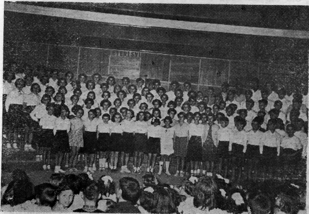
Pjevački zbor Gimnazije na smotri u Dubrovniku 26. V 1954.

U periodu zamašne aktivnosti osnovan je Gradski orkestar, Narodno kazalište, Pionirsko kazalište, Narodna glazba i 18. X 1944. Radio stanica Dubrovnik koja je tokom vremena organizirala razne radio-emisije te utemeljila pjevački radio zbor.