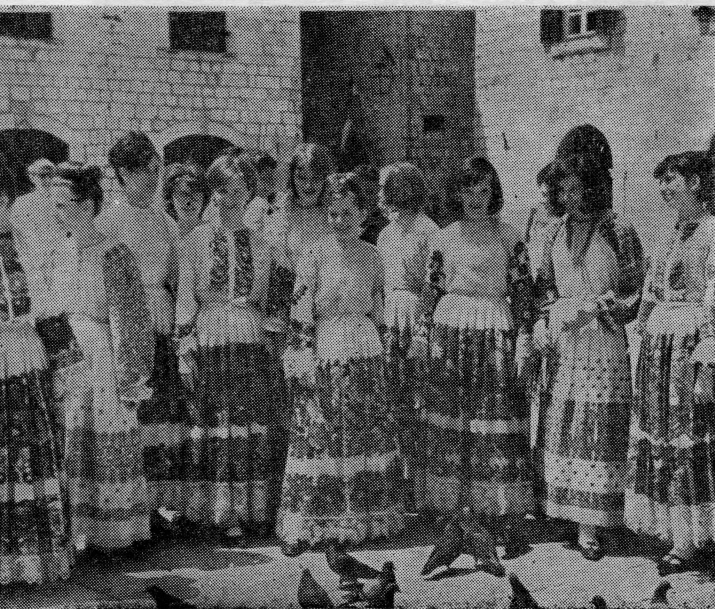
Članovi ansambla »Junior Tamburitza« iz Pittsburgha u Dubrovniku 1965. godine