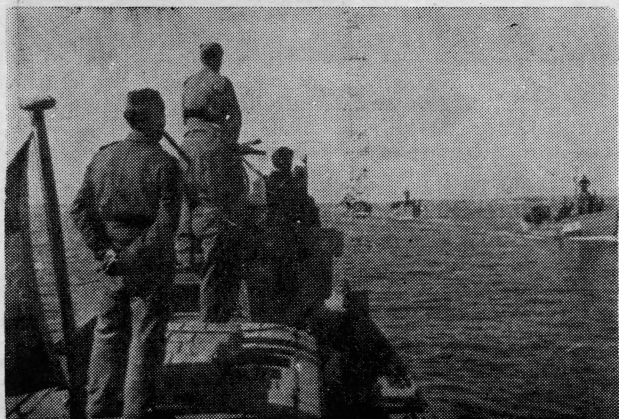
Flotila Kvarnerskog pomorskog sastava

Time se završava jedno istaknuto poglavlje u historiji borbe naših naroda za svoje oslobođenje i ujedinjenje. Narodski napori i legendarno pregaralaštvo boraca naše IV armije i mornarice bilo je okrunjeno potpunim uspjehom. Mnogo brže nego se planom predviđalo oni su oslobodili sve ostale naše otoke i obalu, uključujući i one krajeve koje su nam nepravednim Rapalskim ugovorom talijanskim imperijalistima 1920. bili oduzeli. Oslobođenje Trsta i Slovenskog primorja prije dolaska trupa naših saveznika u to područje bitno je umanjilo mogućnosti eventualnih komplikacija na »spornom« području, za što je neposredno prije, a naročito kasnije, bilo neospornih indicija. U relativno veoma kratkom periodu savladano je oko 140.000 neprijateljskih vojnika i sve njihovo naoružanje i odbrana, smišljenom i skladnom upotrebom svih vidova oružanih snaga u jednom veoma raznoobraznom području gdje je došla do punog izražaja taktika kombiniranja udaraca s fronta i djelovanja u pozadini neprijatelja. Rukovodeći je kadar naše Armije umješnom koordinacijom dejstva na kopnu i moru i uspješnim komando-