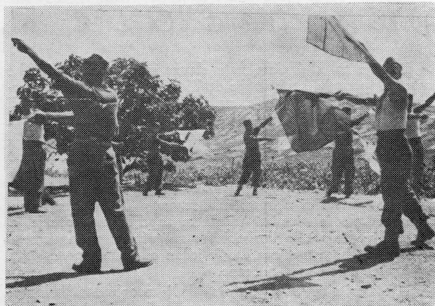
Slušaoci signalnog kursa na Visu 1944. godine vježbaju se u signalizaciji barjačićima

»5) Kako je najbolnije pitanje mornarice uspostava veze unutar pojedinih sektora, između ostrva, to se u prvom redu pristupilo prikupljanju mornara signalne grane, odnosno izobrazbi odgovarajućeg broja drugova