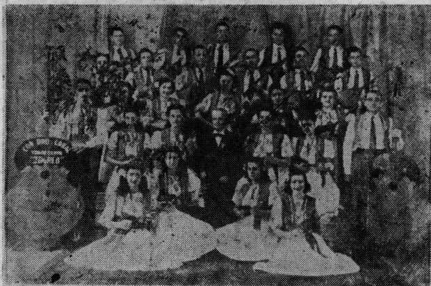
Jugoslavenski tamburaški zbor »Zagreb« u Rosario — Argentina

Za vrijeme prvog svjetskog rata u Buenos Airesu osnovan je ogranak » Jadran « centar Jugoslavenske narodne obrane za južni Atlantik. Ogranaci Jugoslavenske narodne obrane odigrali su značajnu ulogu u propagandi i pružanju podrške Jugoslavenskom odboru u Londonu i raznovrsne pomoći našim narodima za oslobođenje i stvaranje zajedničke slobodne domovine. Ova organizacija prestala je s radom poslije prvog