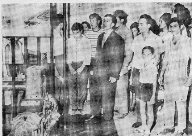
Grupa posjetioca u Vojnopomorskom muzeju