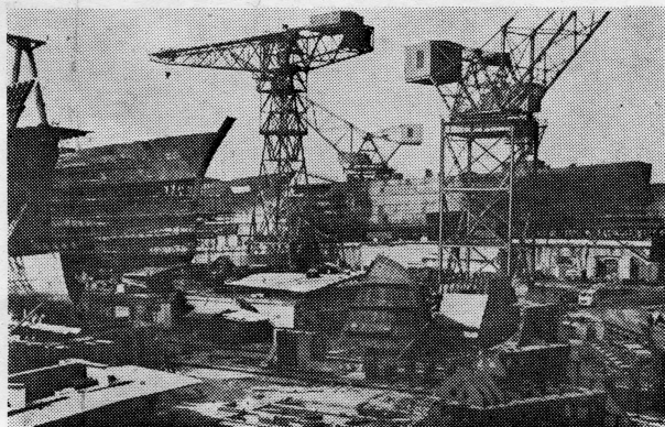
Pogled na brodogradevni dio »Uljanika«

Teča »Uljanikova« djelatnost je brodska elektro-oprema. Istina, ovdje ne možemo govoriti o velikoj brojčano povećanoj proizvodnji, a zato je ovaj odjel uspio usvojiti nove