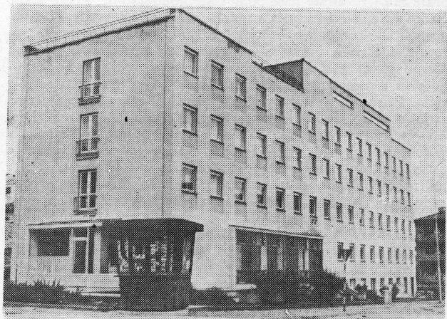
Drugi samački hotel za samce kapaciteta 100 soba — potvrda je brige za radne ljude koja se vodi u »Uljaniku«

Dakle, možemo reći s pravom da se proizvodnja u »Uljaniku« specijalno u posljednje dvije godine, a tu je obuhvaćena i privredna reforma, znatno povećala. Normalno je da je uz povećanu proizvodnju bila povećana i proizvodnost, tim više što broj radnika nije rastao u odnosu na 1964. go-