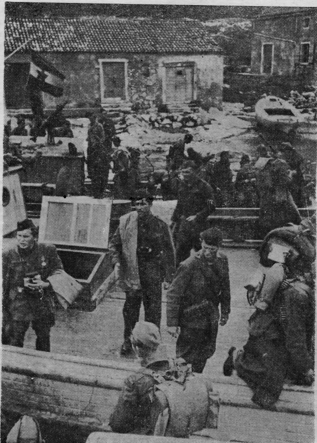
Drveni brodići partizanske mornarice prevoze desantne jedinice

I tako je ovaj mali brodić poslije niza akcija završio u muzeju revolucije u Beogradu, gdje će ostati kao vječiti simbol borbe i slobode generacijama pomoraca.