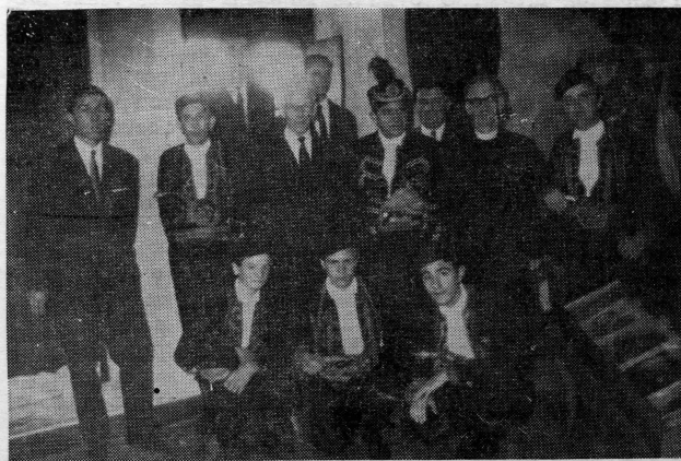
Uprava muzeja sa članovima Bokeljske mornarice nakon svečanosti