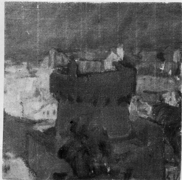
Viktor Šerbu, ulje — »Minčeta«