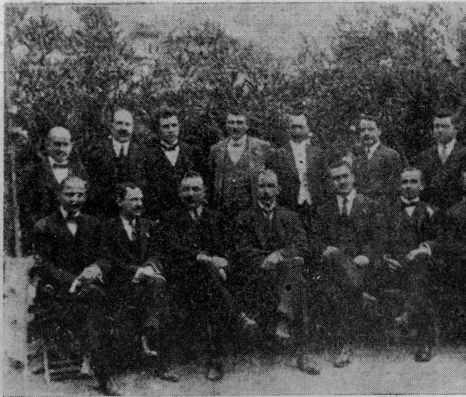
Privremena uprava Jugoslavenske narodne obrane u Antofagasti 1915. godine