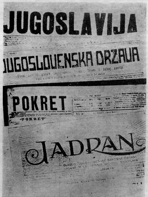
Faksimil listova Jugoslavenske narodne obrane u Antofagasti

Jugoslavenski iseljenici širom svijeta tako i u Antofagasti čuvajući svoj jezik i običaje prihvatili su novi način života u novoj domovini. Oni pokazuju visoku moralnu svijest i žive u mislima na svoj Stari kraj, a isto tako raduju se i pomažu