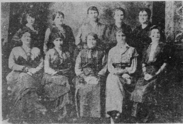
Odbor ogranka Jugoslavenske narodne obrane »Kosovka djevojka«, Antofagasta — Čile