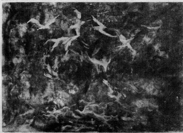
»Šiloko« — akad. slikar Ljupko Kolovrat

Na čistom nebu žmirkale su zvijezde, u daljini se gubio trag Jakovljevih vesala u svijetlo-srebrnastoj pjeni. Još je bila noć.