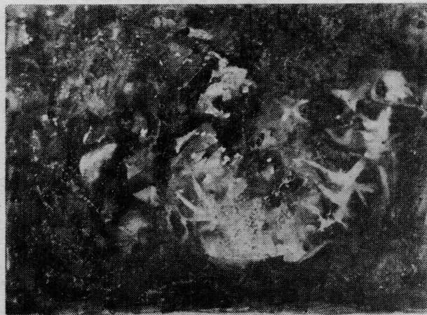
»Galebovi« — akad. slikar Ljupko Kolovrat