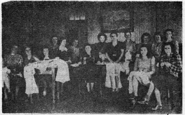
Naše iseljenice i njihove kćeri u Puerto de Porveniru — Čile, pripremaju odjeću za pomoć narodu u starom kraju