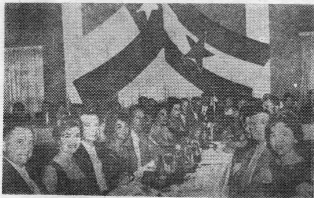
Svečana večera prigodom proslave Dana Republike u Domu Jugoslavenskog pripomoćnog društva u Antofagasti