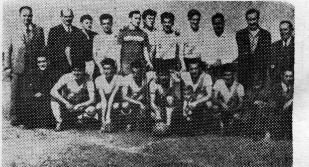
Momčad i članovi uprave nogometnog kluba »Jadran« u Santiagu