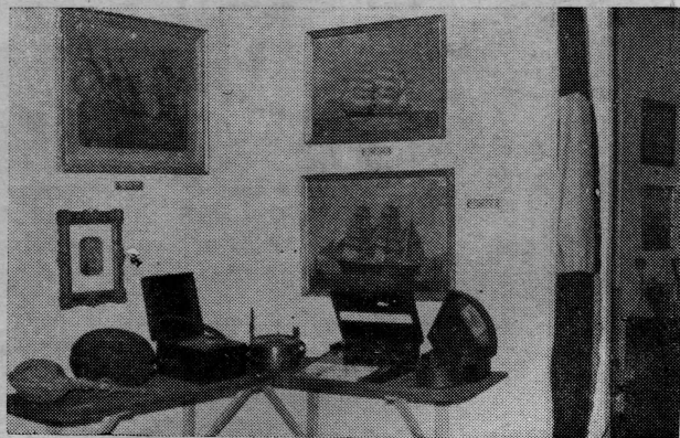
Iz Pomorskog muzeja u Orebiću