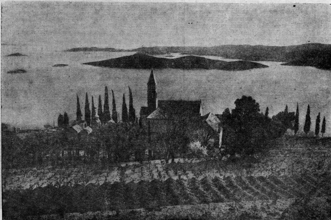
Orebić na poluotoku Pelješcu

Napomena redakcije: Ova istorijska okosnica nije dokumentirana zbog toga što je ona sastavni dio knjige istog autora »Partizanske borbe na Pelješcu« a koja još nije štampana, ali će uskoro izaći iz štampe. Izdavač ove knjige je Muzej NOB općine Dubrovnik. U toj knjizi za svaki događaj spomenut u ovoj okosnici, napisana je i dokumentacija, pa autor nije smatrao potrebnim citirati dokumente posebno, jer se ova okosnica potpuno oslanja u tom smislu na pomenutu knjigu.