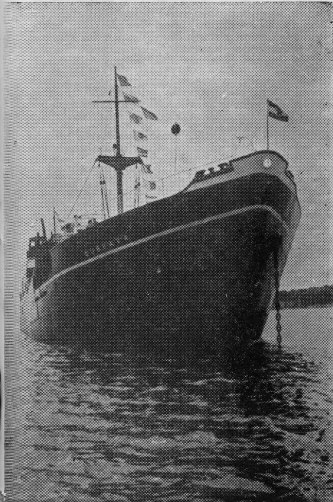
Naši brodovi u svečanom ruhu dočekuju veliki praznik