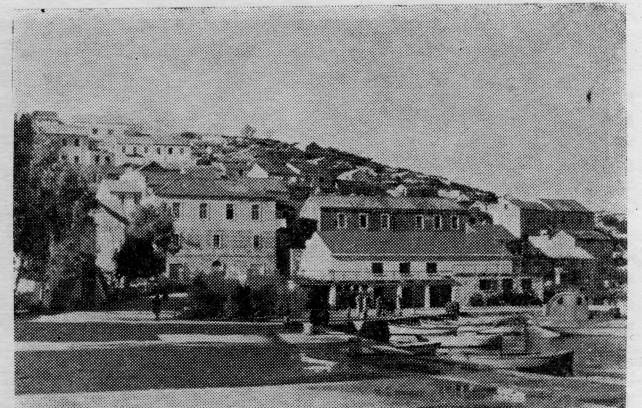
Osmogodišnja škola i kulturno prosvjetni dom u Račišću