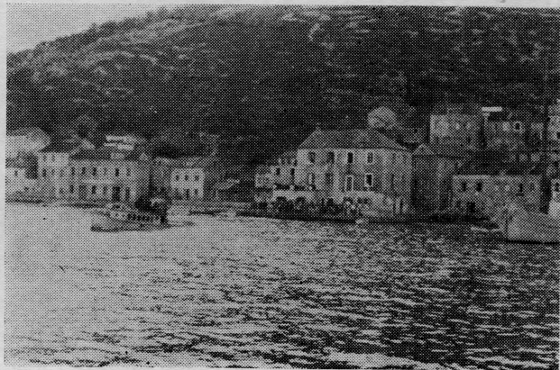
Račišćani pozdravljaju svoje iseljenike pri odlasku