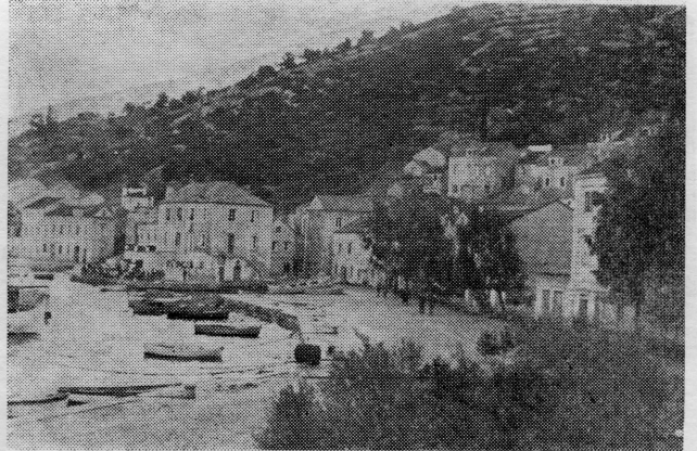
Obalni dio Račišća

Oj Račišće, plemenito selo, Ja odlazim ostaj mi veselo! Valo, valo, nemoj odavati Druga mladost kada bude pivati! Zbogom majko koja si me rodila! I bilim mlikom zadojila! Zbogom moji prijatelji mili, Lipo li smo vrime sprovodili! Zbogom starci i mala dičica I ti moja mila golubica! Zbogom ptice u zelenom gaju, Zbogom, zbogom mali zavičaju! Sve je meni zaboravit lako, Staru majku nemogu nikako. Nećeš više govoriti majko, Kiša pada spavaj sine slatko, Nego ćeš se u suzama obliivat Kad mi budeš postelju načinjat. Zbogom moji od punte skalini, Na kojim smo vrime sprovodili. Zbogom moje sve Račiške divne, Lipo li smo sprovodili vrime. Zbogom ostaj rodbino moja, Ja se dilim od sela ovoga, Od Račišća sela malenoga. Zbogom ostaj rodna kuća moja, Opet ćemo piti oko ovog stola Iz Zelande, kad se vratim doma.