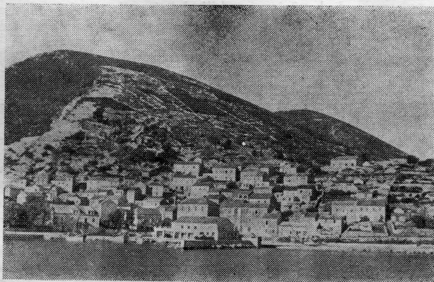
Račišće — zapadni dio mjesta

Suradnja i veze između iseljenika i njihova rodnog mjesta dolaze do izražaja i sigurno je da će i u buduće još više održavati na korist i napredak Račišćana u mjestu i onih koji žive u novoj domovini.