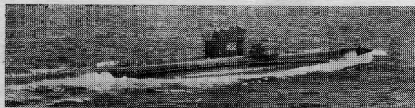
Za koji trenutak ona će zaroniti u plave dubine Jadrana

Onaj »prvi kontakt«, u početku, odnosio se na susret brodova sa podmornicom. Ovi ostali, samo su kratki dodiri sa ljudima, vrlim mornarima i starješinama sa naših brodova. Zato jer su vrli, mogu da upravljaju takvim kompliciranim mehanizmima kakvim je nakrcan svaki naš ratni brod.