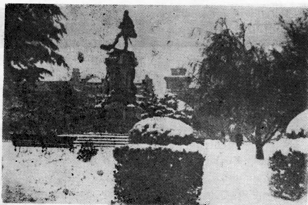
Spomenik Magellanu u Punta Arenasu

Kao i na drugim područjima tako su naši iseljenici i u Ognjenoj Zemlji ispoljavali uvijek svoju ljubav i patriotizam prema jugoslavenskim narodima i Starom kraju, ali osobito za vrijeme drugog svjetskog rata. Moralna i materijalna pomoć dolazila je do izražaja. Oni su ostali uvijek vjerni sinovi svoje stare domovine iz koje su zbog teških ekonomskih prilika iselili. Mnogi su od njih našli svoje stalno prebivalište u novoj domovini i dugogodišnjim radom i odricanjima stvorili imetke i postali važan faktor u Magellanesu, kao i na drugim područjima i zemljama širom svijeta.