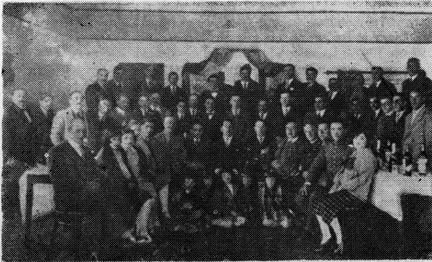
Iseljenici u svom Domu u Natalesu Čile 1930 god.

Prije dolaska kolonista u Ognjenu Zemlju živjeli su domoroci koji su kasnije potisnuti prema jugu u predjelje gdje zbog oštine klime raste grmlje i nisko drveće. Danas u Ognjenoj Zemlji živi oko 15.000 stanovnika među kojim je vrlo mali broj domorodaca. Ranije naseljavajući čitavu Ognjenu Zemlju i područje Magellanova prolaza stalno su podržavali vatru na kopnu i u čamcima, pa je toj razlog zašto je Veliki otok i otočna skupina dobila naziv Ognjena Zemlja. Domoroci su se dijelili u tri plemenske grupe. Na zapadu prema Tihom oceanu živjeli su domoroci plemenske grupe Alakaluf, u središtu otoka grupe Jamana, a na istoku plemenska grupa Ona. Živjeli su tada pa i do nedavnog vremena na nivou kamenog doba. Oružje i oruđe bilo je od kamena, školjaka i drva. Većinom im je bilo zanimanje ribolov, a pripadnici plemenske grupe Ona bavili su se lovom na životinje pomoću kamena na dugom konopcu. Sabirali su gljive, rakove i školjke. Od krzna i danas prave odjeću. Kolibe prave od pruća a pokrivaju ih lišćem, granama ili krznima. Čamce su ranije pravili od bukove kore koje su prošivali trakovima od bukve ili od kitove kože. U čamcima su često boravili danju i noću za vrijeme ribolova.