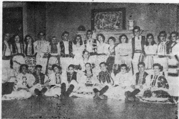
Djeca naših iseljenika u Santiagu — Čile