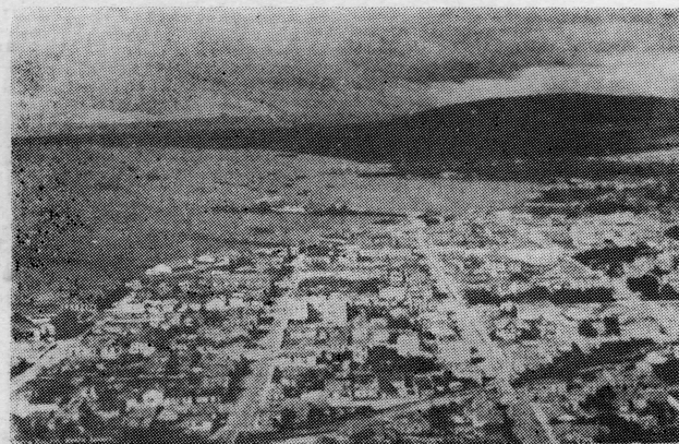
Grad i luka Punta Arenas u Čileu