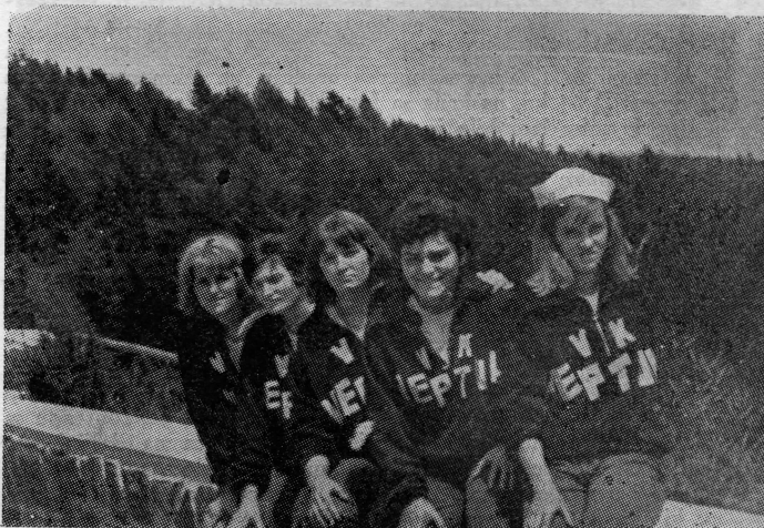
Momčad ženskog četverca, koja je na prvenstvu SFRJ u Mariboru 1964. godine osvojila treće mjesto