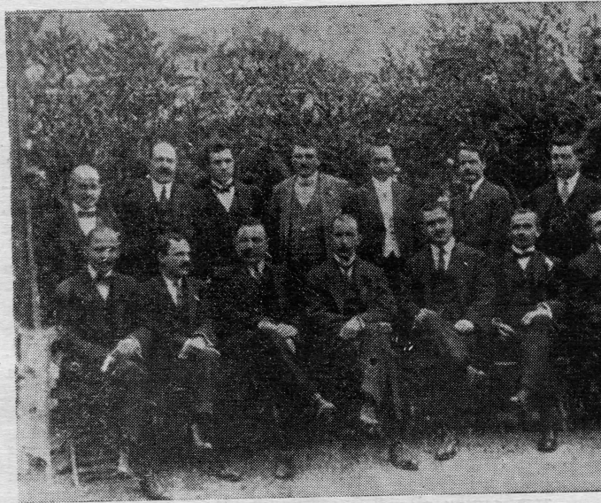
Privremena uprava Jugoslavenske narodne obrane u Antofagasti 1915. godine

Kad se je na jednom terenu iscrpila salitra, tvornice su se prenosile i podizale na drugim mjestima, gdje su veće naslage salitre rudače i gdje je veća eksploatacija. Veliki prihodi dobivali su se od nuz produkta, tj. čistog joda. Baburica koji je imao tvornice na sjeveru, seli na jug i kupuje nove tvornice. Njegovo ime postaje ime industrijske i trgovačke kompanije koja je preko 20 godina reprezentirana na Pacifiku, u Engleskoj i Americi kao najveća i najsolidnija firma — PASCUAL BABURIZZA.