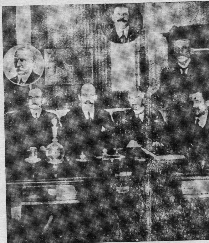
Središnja uprava Jugoslavenske narodne obrane u Valparaisu — Chile Izabrana na velikom zboru 21-23. siječnja 1916. godine