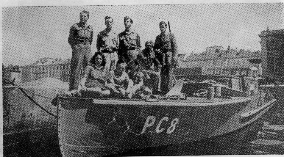
PČ-8 »Udarnik« bio je prvi naš i saveznički brod koji je 5. maja 1945. godine uplovio u oslobođenu Tršćansku luku.