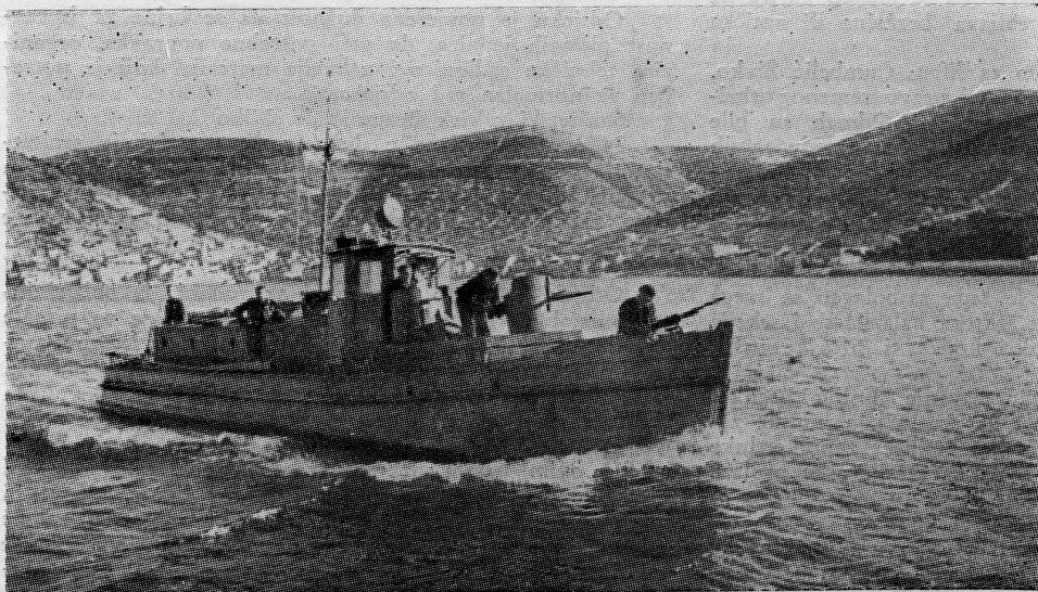
»Biokovac« — jedan od partizanskih naoružanih drvenih brodova

mjera. Nijemci su smatrali da partizanske snage, koje su se nalazile na Visu i spremale obranu otoka od mogućeg njemačkog napada nisu u stanju da izvrše bilo kakvu desantnu akciju u njemačkoj pozadini, a svaki pokušaj iskrcavanja na udaljena područja Pelješca ili Mljeta bez jake podrške avijacije i mornarice izgledalo im je kao utopija. Interesantno je napomenuti da su u pogledu desantnih akcija na područje južnog Jadrana i saveznici imali slično mišljenje. Kada je zatražena pomoć njihove mornarice prilikom planirane akcije na Mljet i Korčulu krajem travnja 1944. oni su odgovorili, da neće učestvovati u akciji koja nema nikakvog izgleda na uspjeh. (Kasnije su nam saveznici pružali pomoć).