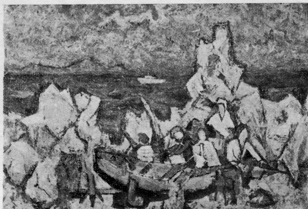
D. Pulitika: Porinuće partizanskog leuša pred napad na neprijateljski brod

U ovoj akciji je učestvovalo još pet naših invazionih brodova koji su uglavnom prevozili trupe, šest britanskih invazionih brodova, a čitav konvoj je imao zaštitu engleskih ratnih brodova i savezničkih aviona koji su istovremeno bombardirali neprijateljske položaje.