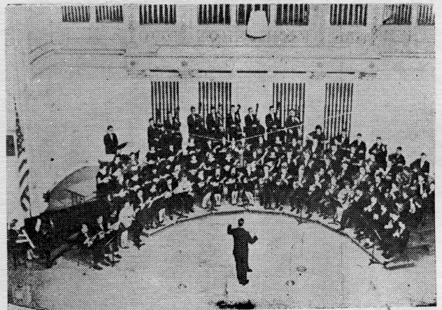
Filharmonijski orkestar kulturno-umjetničkog društva »Tamburica« 1961. godine