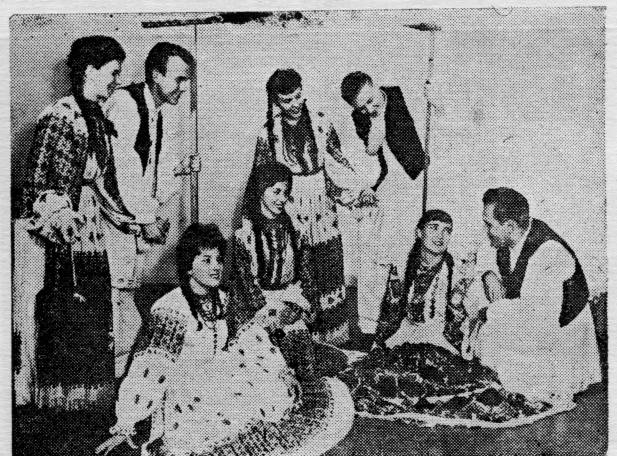
Grupa mladih članova »Tamburice«