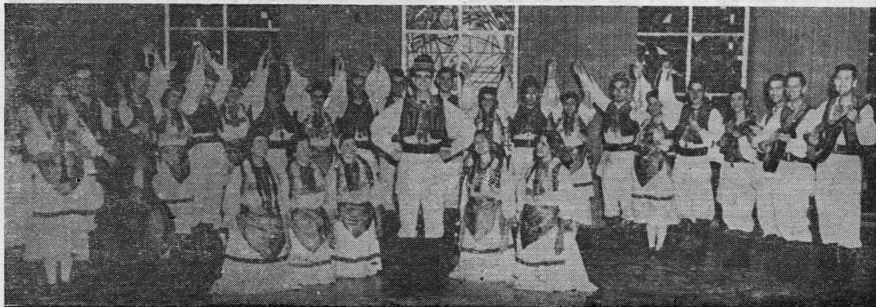
Folklorno-tamburaška grupa »Tamburica«

Kakve su ih sve brige obuzimale pri odlasku i na putovanju, a kakve radosti su se stvarale kad bi konačno stigli na radno mjesto. Nitko nije pravio pitanje kakav je posao,