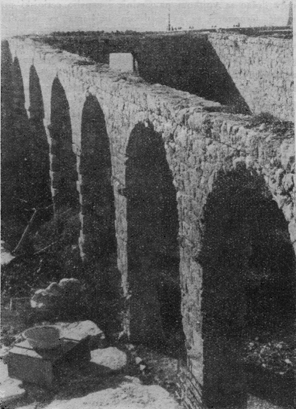
Karakteristična slika bijede. Zub vremena bio je počeo nemilosrdno uništavati jednu lijepu i dostojanstvenu građevinu.

U Dubrovniku je postojala posebna knjiga — LIBER VIRIDIS — u kojoj su bile kodificirane sve veoma stroge odredbe o zaštiti od kuge. Jedna od tih odredaba je, da je stanovnicima Dubrovnika i okolice bilo najstrožije zabranjeno posjećivati internirane i tko se toj zabrani ne pokori, mora biti mjesec dana zadržan u kontumaciji karantene. Tko bi iz Dubrovnika otputovao u kužne krajeve i zatim se htio vratiti, ne prošavši kroz karantenu, bio je kažnjen globom od 100 perpera i kontumacijom od dva mjeseca, tko kaznu nije izdržao ili joj htio izmaći, bio je stavljen na muke. 1397. ovlašten je knez i Malo vijeće da izaberu potrebno osoblje, koje će voditi nadzor nad putnicima i došljacima iz okuženih mjesta, a prema potrebi i kažnjavati one, koji se ne pokore odredbama Republike prigodom dolaska iz stranih, osobito zaraženih krajeva. Ovo nadzorno osoblje moralo je stalno promatrati kretanje uz obalu i prijeći nepozvanima ulaz u grad ili iskrcavanje robe, odnosno ljude i robu podvrći nadzoru i postupku u karanteni. Uz to se moralo obavještavati o kretanju epidemije i o tome odmah podnositi izvještaj Malom vijeću. Ovo je zdravstveno osoblje kasnije dobilo vrlo veliku važnost i postalo je vrlo važna zdravstvena ustanova.