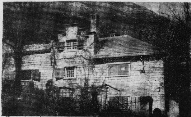
Kuća-muzej Štumbergera u Baošiću

U bujnom zelenilu južnog rastinja utonula je kuća-muzej starog morskog vuka Miroslava Štumbergera, jednog od najpoznatijih muzeologa na Jadranu. Ovaj stari pomorac, kapetan bojnog broda u penziji, rodom iz mjesta Šmarije kod Rogaške Slatine, posjeduje rijetku zbirku raznih starina, osobito iz pomorske prošlosti Boke Kotorske, koja danas pretstavlja historijsku rijetkost od ogromne vrijednosti.