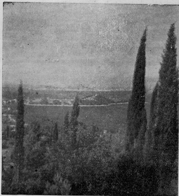
Uvala Tiha kod Cavtata.

Na osnovu podataka, koji ni izdalka nisu potpuni, danas se nalazi u iseljeništvu preko milijon i pol naših ljudi. Od toga otpada preko jedan milijon na našu Narodnu Republiku. Matice iseljenika Jugoslavije podržavaju kulturne i rodoljubive veze sa mnogim našim iseljenicima. Svake godine veliki broj iseljenika dolazi u posjetu svojoj domovini a među njima, sada turistima, nalazi se veliki broj omladine, koja dolazi u posjetu domovini svojih otaca. Namjena ovog napisa je bila da u najkraćim crtama prikaže povezanost naših iseljenika i pomoraca, njihov zajednički život u inostranstvu, njihov rodoljubivi osjećaj prema staroj domovini i jaku materijalnu pomoć koju oni ukazuju svojoj staroj domovini već decenijama. No nije ni iz daleka ovdje opisan rad, ljubav pomoć i samoprijegor naših iseljenika-pomoraca, koji su oni davali tokom decenija svojoj staroj domovini. To je posebna studija, koja će jednog dana resiti naš iseljenički muzej i arhiv, gdje će historijski ostati zabilježena velika djela.