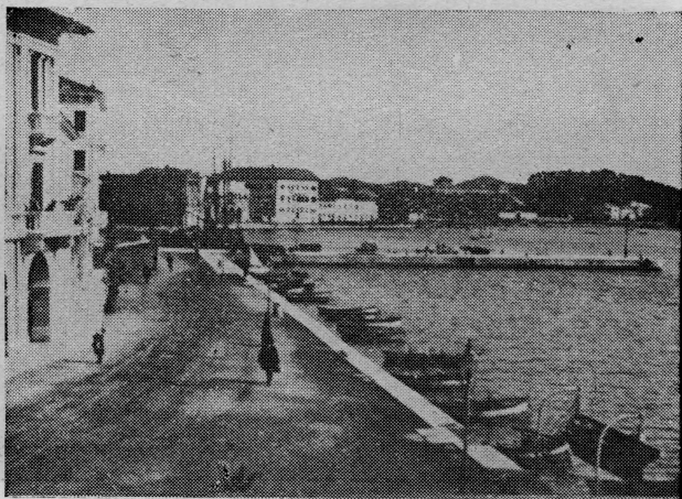
Poreč — luka