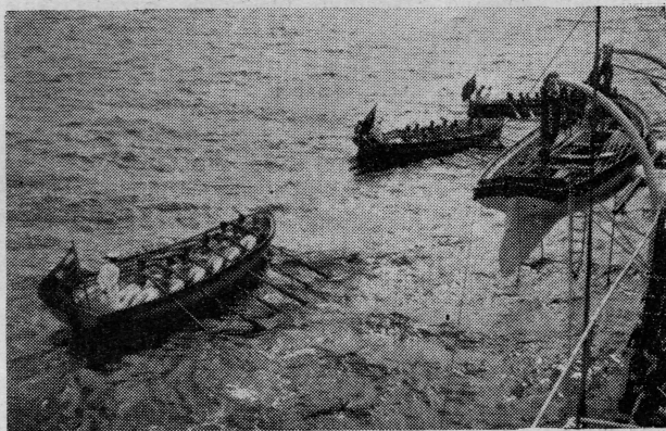
Pitomci JRM na sportskim natjecanjima

Kroz granje pomolio se mjesec. Krvav ... javila se neka noćna ptica. Puče top negdje daleko. Jedan život osta u brdu. Nešto šušnu u mraku ... zvijezde kao da ne vjeruju mjesecu ostadoše ukočene ... zatim se skupiše, ... i zaigraše Kozaračko kolo.