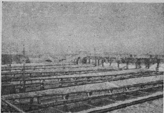
Sušionica salitre u Chile-u

U to vrijeme u njujorškoj luci već su se vidjeli u si-vo obojeni brodovi, kao vidljivi odjeci ratnog stanja i prvi znaci opreznosti u plovidbi morem. Dobiveni zadatak da odmah otplovi, »Tomislav« nije mogao izvršiti, jer je prethodno trebalo posvršavati poslove osiguranja bro-