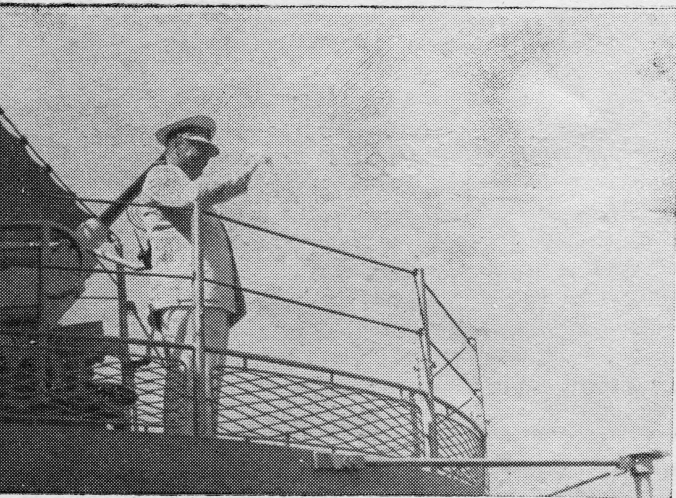
Maršal Tito pozdravlja na odlasku za Etiopiju

je tražio, da se za svako putovanje izvrši što veća izmjena kadrova na brodovima, da bi se omogućilo što većem broju ljudi sticanje iskustva na ovim dužim putovanjima.