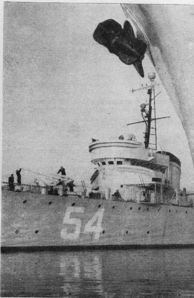
Razarači u luci