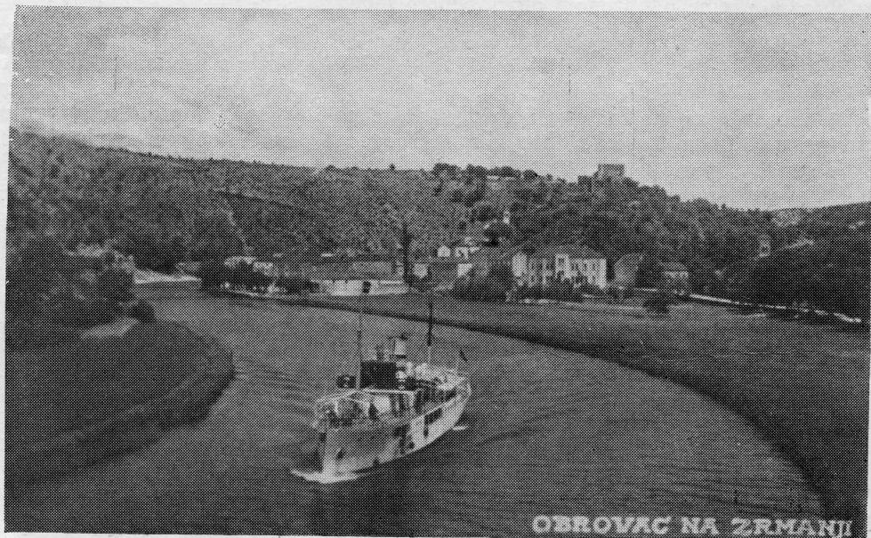
OBROVAC NA ZRMANJI