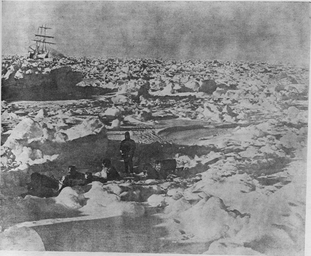
Brod ekspedicije u Antartiku bespomoćno leži okružen snijegom i ledom

Mornarica SAD objavila je nedavno, da namjerava ponovno poduzeti ekspedicije na Antartik i otpočeti instalacijom triju baza, koje trebaju početi da funkcioniraju u augustu 1957. godine. Izgleda, da će glavna baza biti na Rossovoj Zemlji, gdje se jednom nalazio Zaliv Kitova, sjedište »Little Amerike«, prethodne baze ekspedicije admirala Byrda. Druge dvije baze će biti instalirane: jedna na Zemlji Mary Byrd, a druga na geografskom južnom polu. Ekspedicija, nazvana operacija »Deep Freeze« otputovat će skoro s jedne točke na zapadnoj obali SAD, a raspolažat će sa pet brodova, koji će činiti pomorsku snagu br. 34 pod komandom admirala Byrda. Byrd ima sad 66 godina i nalazi se u rezervi, da bi za slučaj potrebe mogao biti pozvan u aktivnu službu. Asistira mu C. V. Dufek, drugi veterani američkih polarnih istraživanja.