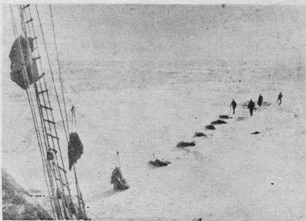
Transportiranje na brod svježih krzna

Od 1923. Nova Zelandija ima pod svojom upravom sektor Zaliva Kitova i Rossovog Mora, a Australija predio između Victoria Land-a i Enderby Land-a. Među ovim dvjema zonama nalazi se mali francuski sektor. Queen Maud Land pripada Norveškoj. Argentina smatra svojim sav predio između nacionalnog teritorija i pola priznajući ipak pravo »otvorenih vrata«. Čile reklamira za svoj polarni sektor između 53-eg i 90-og stepena zapadne dužine. Dok se potraživanja Argentine protežu i na Falklandske dependanse, Čile, osim toga, hoće još i dio sektora traženog od Argentine pod svoj posjed.