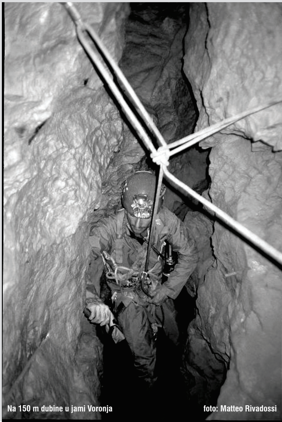
Na 150 m dubine u jami Voronja

posumnjao na lom pete i gležnja, trtice i kralježnice, no na sreću nije bilo neuroloških simptoma. Transport je bio moguć samo u nosilima i to što više u vodoravnom položaju. Glavni je problem bio 250 m dugi meandar, mjestimice jedva prohodan i to većinom po sredini i pod stropom, a ostalo su bili koljenasti jamski kanali. U međuvremenu su stigli spasioci iz Sočija. Rusija nema prave speleološke službe spašavanja. Imaju profesionalne spasioce koji spašavaju iz planina, mora i teško dostupnih mjesta kamo ubrajaju i jame. Iako su prilično dobro opremljeni i poznaju vertikalnu tehniku, osim rijetkih među njima, nemaju speleološkog iskustva. Unatoč tome su