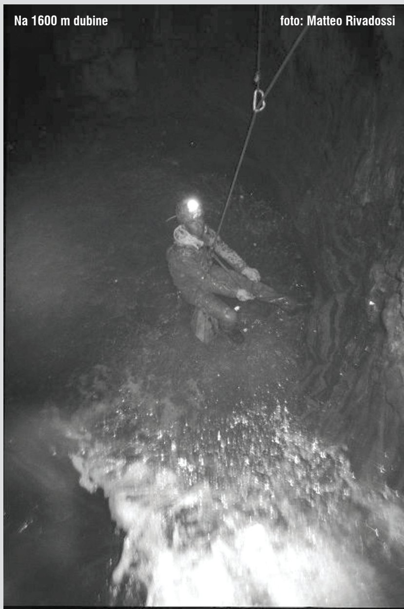
Na 1600 m dubine