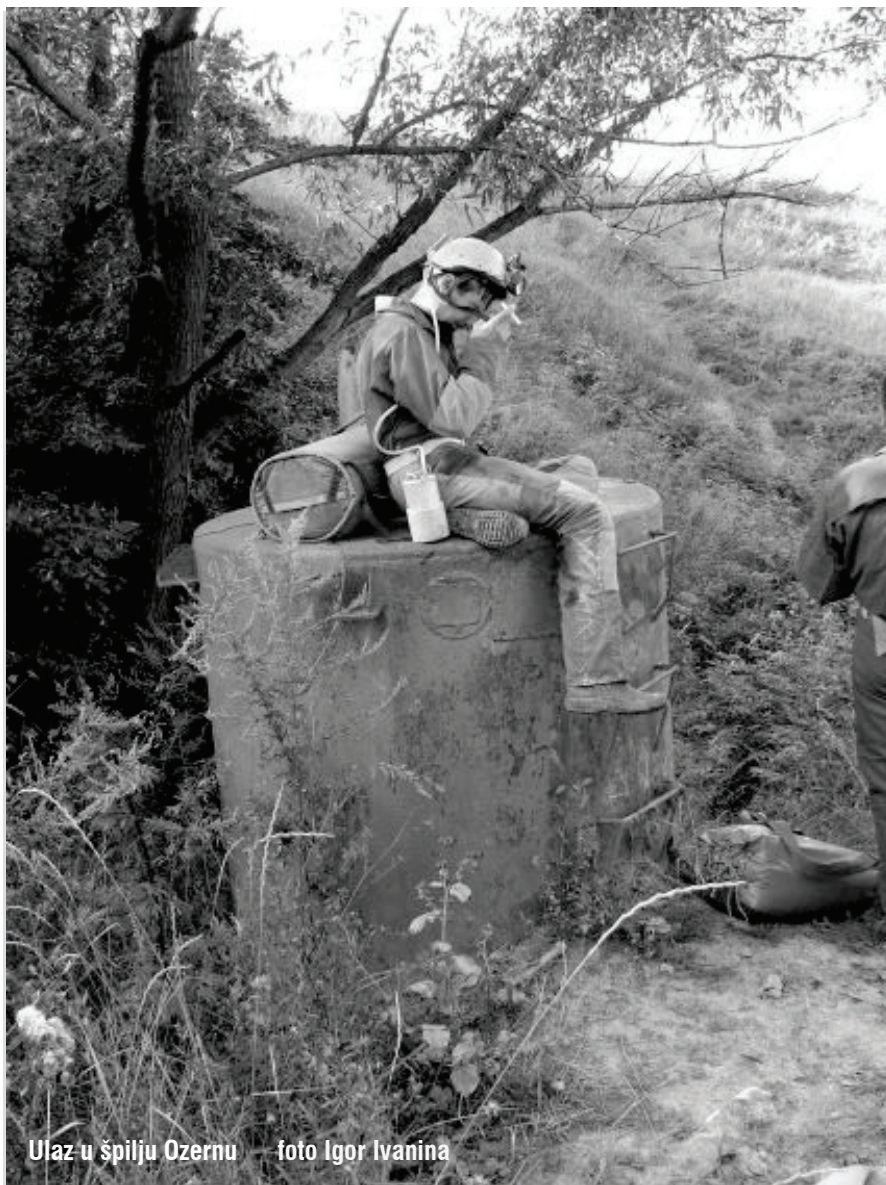
Ulaz u špilju Ozernu