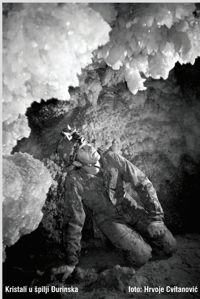
Kristali u špilji Đurinska