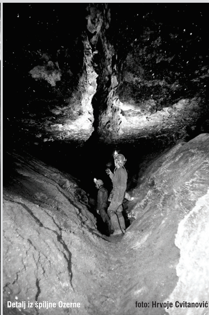
Detalj iz špiljne Ozerne