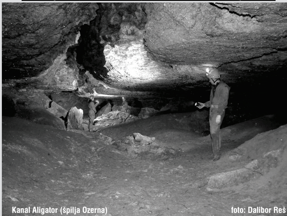
Kanal Aligator (špilja Ozerna)