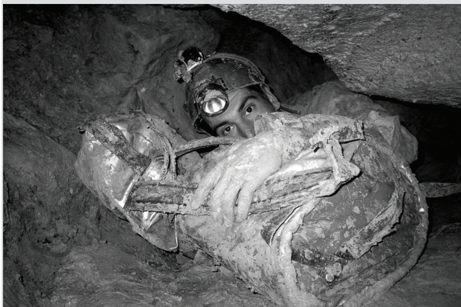
Ulazni dio špilje Đurinske