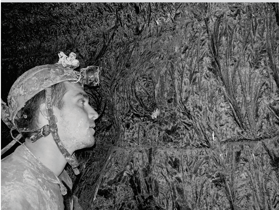
Detalj iz špilje Đurinske