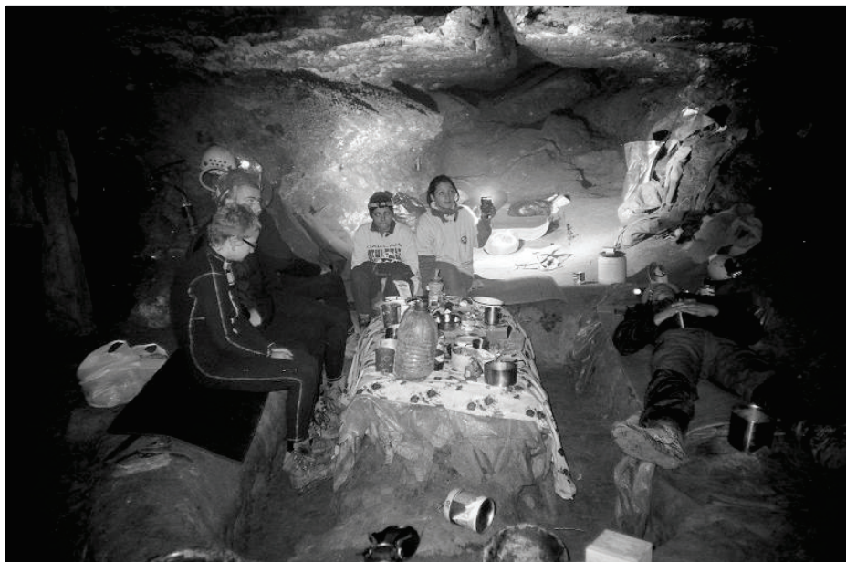
Kamp 2 u špilji Ozerni