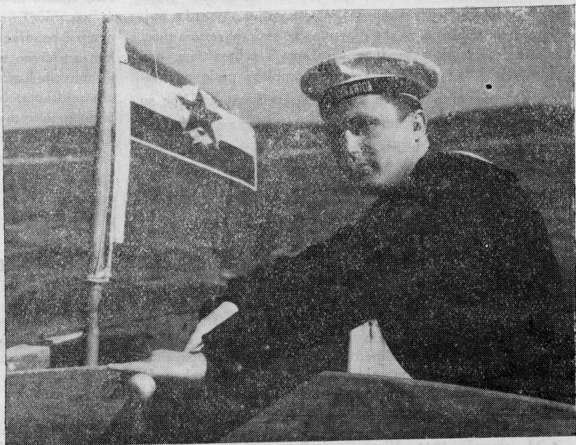
U kuteru . . .

Minolovci su očistili rute zagađene minama na površini od 612 Nm 2 i tom prilikom uništili ili onesposobili 8.800 komada raznih mina.