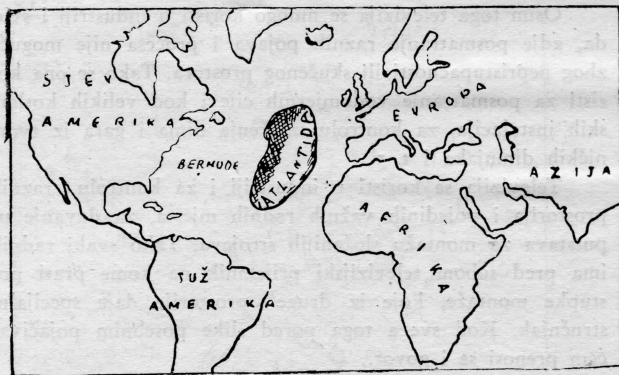
Predio gdje bi se navodno bila nalazila Atlantida

Ove Platonove rečenice dale su povoda studiju i nagađanjima o Atlantidi sve do naših dana. Geografi Murray i Heer su između posljednjih u našem stoljeću, koji nastoje dokazati opravdanost mišljenja o postojanju tog velikog kopna u oceanu.