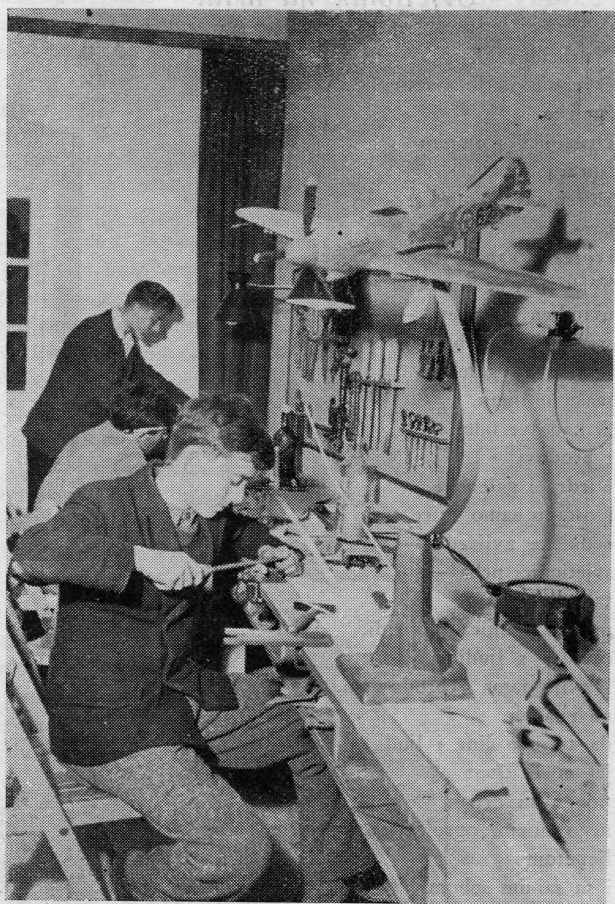
Detaljniji rad modelarskog tečaja u aero-klubu „Rudi Čajevac“

Za vrijeme zimskih školskih praznika u saradnji sa Savjetom za prosvjetu i kulturu organiziran je seminar za 20