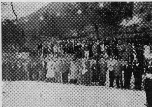
Illuminacija Župe nakon puštanja u pogon nove trafostanice Narod Župe i uzvanici slušaju prigodne govore

zuje nova cesta s njihovim središtem Dubrovnikom. Zajednička večera nije bila obična gozba. Na njoj se je očitovala želja stanovnika četiri sela Gornje Župe: Buića, Makoša, Grabavca i Martinovića, da u bratskoj slozi nastave dalju izgradnju svojih sela. Pozdravno pismo Andru Sambrailu, koje su svi učesnici slavlja potpisali, ponijelo je na daleki južno-američki kontinent izraze ove velike želje.