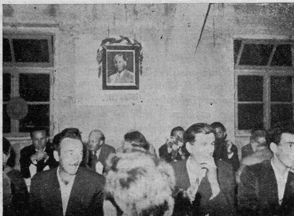
Nakon svečanosti elektrifikacije Gornje Župe do kasno u noć trajalo je narodno veselje