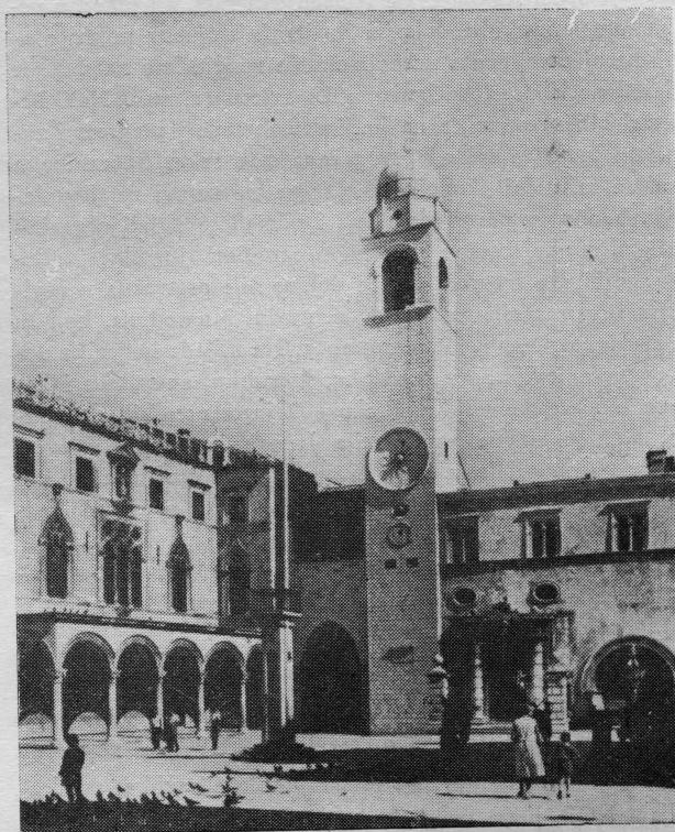
Obnovljeni zvonik u Dubrovniku darežljivošću Paska Baburice

Nakon rata bilo je mnogo iseljenika koji su se vratili u domovinu. Ali njih kao i ostale razočarala je karadordevičeva Jugoslavija, koja nije ispunila narodne težnje i želje. To razočaranje bolno je djelovalo ne samo među našim narodima u domovini, nego među svim iseljenicima. Većina onih koji su se povratili odlaze natrag u iseljeničtvo i vode