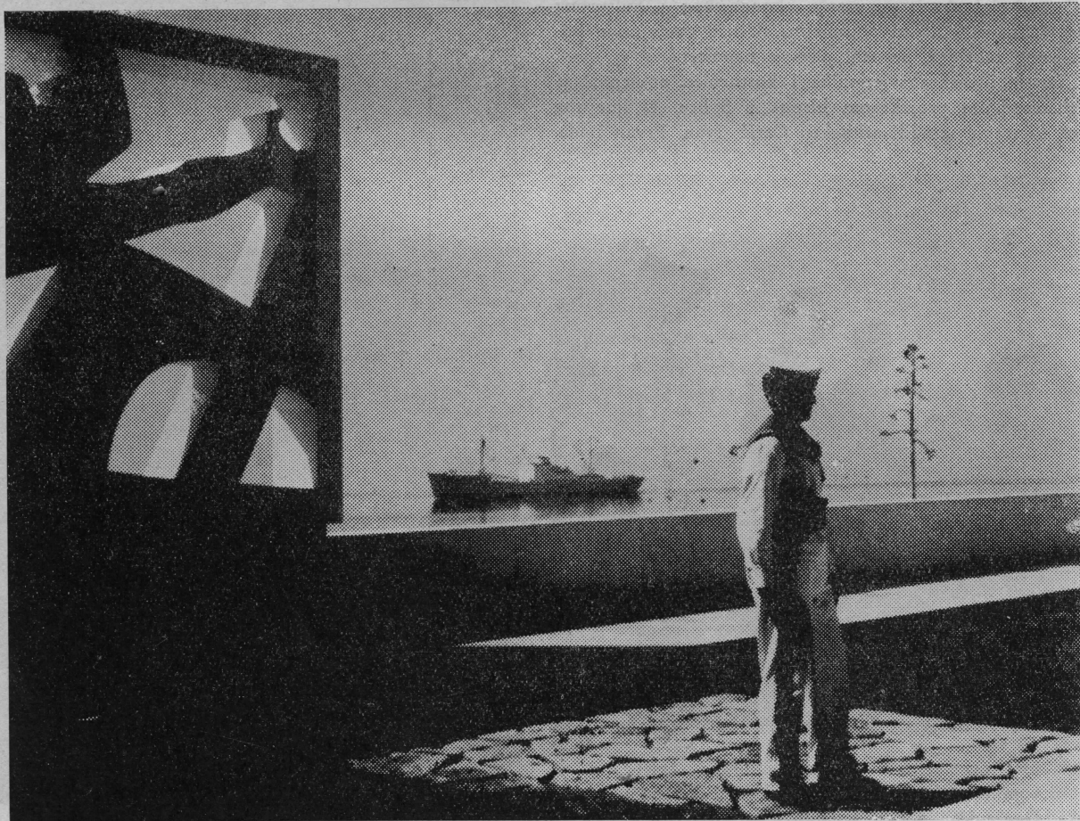
Detalj spomenika »Nepoznatog pomorca«