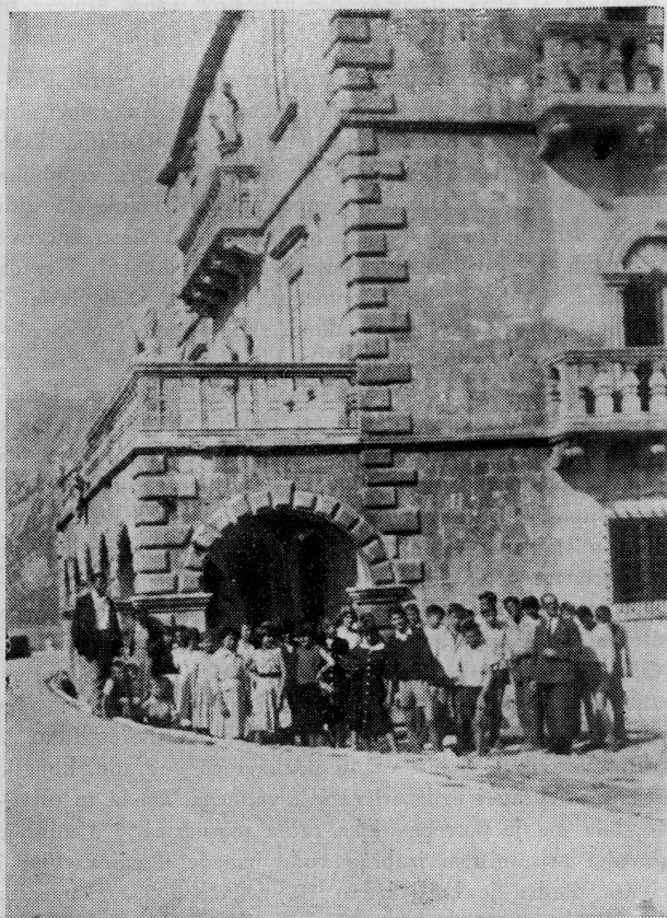
Zavičajni muzej u Perastu