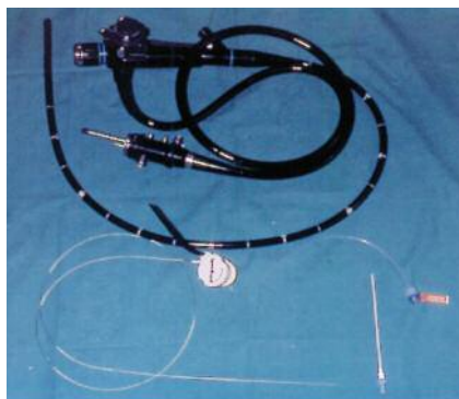
Slika 1. Gastrooskop