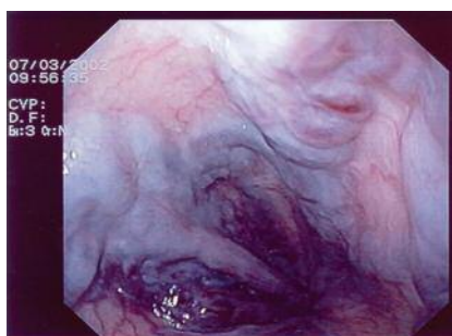
Slika 4. Variksi jednjaka