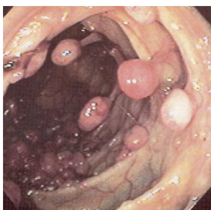
Slika 3. Polipi tankog crijeva