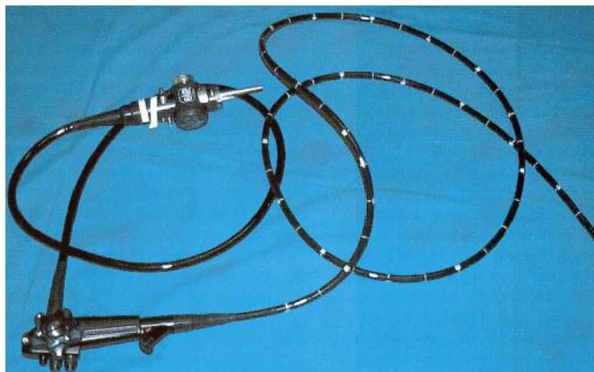
Slika 2. Enteroskop