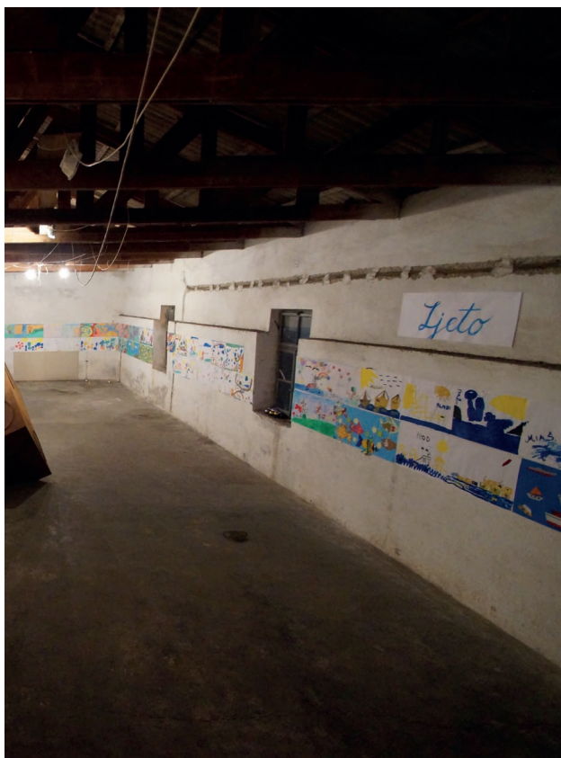
Izložba „Četiri godišnja doba“