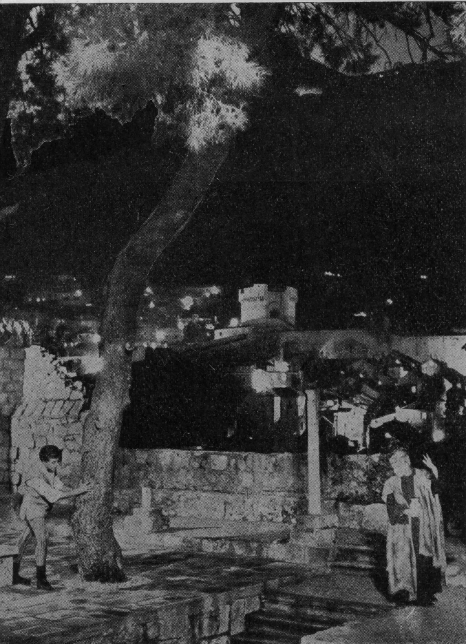
Držićeva komedija »Skup« prikazana noću u parku Gradac

Fizionomija Dubrovačkih ljetnih igara uglavnom je utvrđena. Dubrovačke ljetne igre su tribina s koje klasična dramatika i suvremena kazališna dostignuća jugoslavenskih naroda progovaraju kroz medij jedinstvenog grada Dubrovnika, koji je čitav jedna fantastična pozornica. Nastale na tlu gdje svaki kamen evocira uspomenu na neku predstavu u davnoj renesansnoj prošlosti usko vezanu s morem i pomorstvom. DUBROVAČKE LJETNE IGRE predestinirane su da u prvom redu budu scena za izvođenje klasičnih dje-