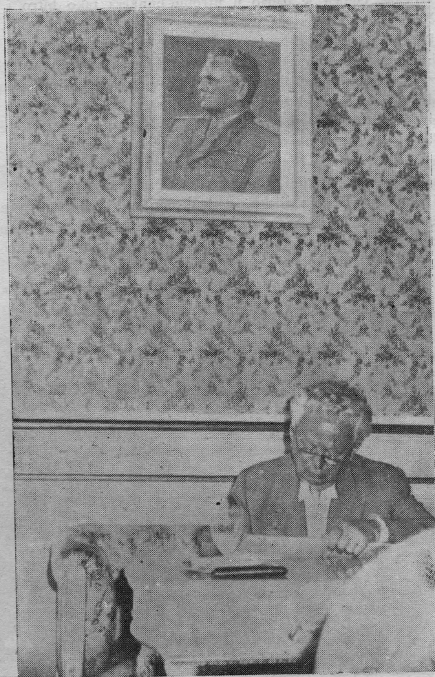
Predsjednik Dr. Ivan Ribar prigodom boravka u Dubrovniku posjetio je i NO općine. Na slici vidimo druga Ribara kako se upisuje u knjigu posjetioca