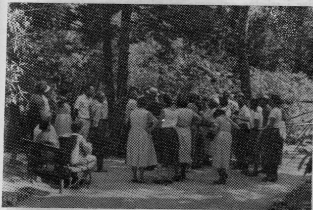
Članovi Hrvatske bratske zajednice na Lokrumu 2. kolovoza 1960.

Nakon turneje kroz Jugoslaviju članovi prve i druge grupe našli su se u Zagrebu, gdje im je 16. kolovoza potpredsjednik Sabora NRH Karlo Mrazović priredio prijem u Saboru.