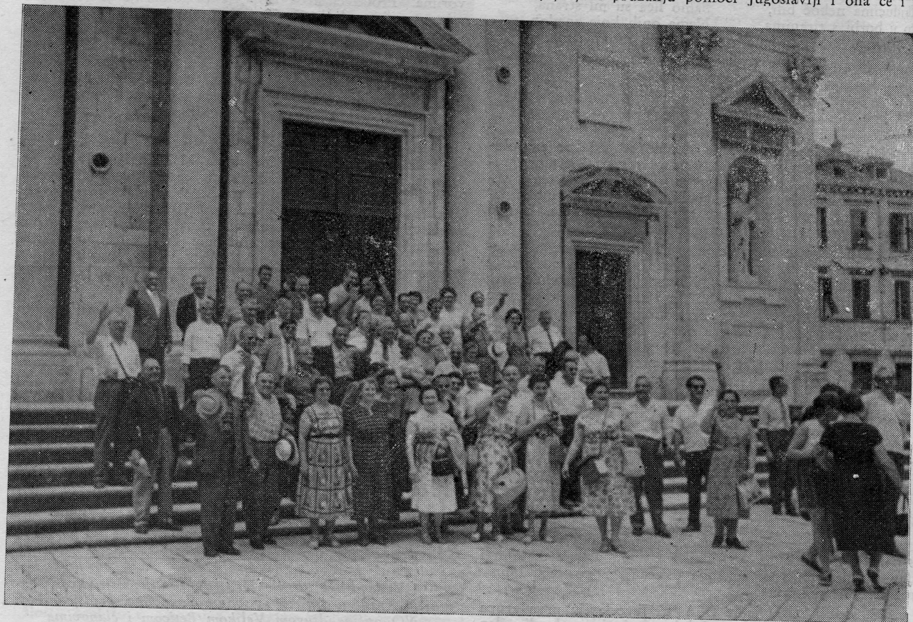
Učesnici druge turneje Hrvatske bratske zajednice na Držičevoj poljani u Dubrovniku 9. kolovoza 1960.